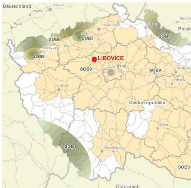
Obr.2: PÚR – Specifické oblasti